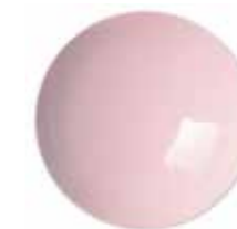
Acrygel Milky Pink 60 ml - Rosa tenue coprente 0282