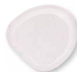
Fastgel Glass Glitter 15 ml - Trasparente glitterato 0226