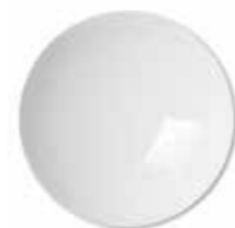
Acrygel Glass 60 ml - Neutro satinato 0280