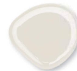
Fastgel Milky White 15 ml - Bianco lattiginoso 0227