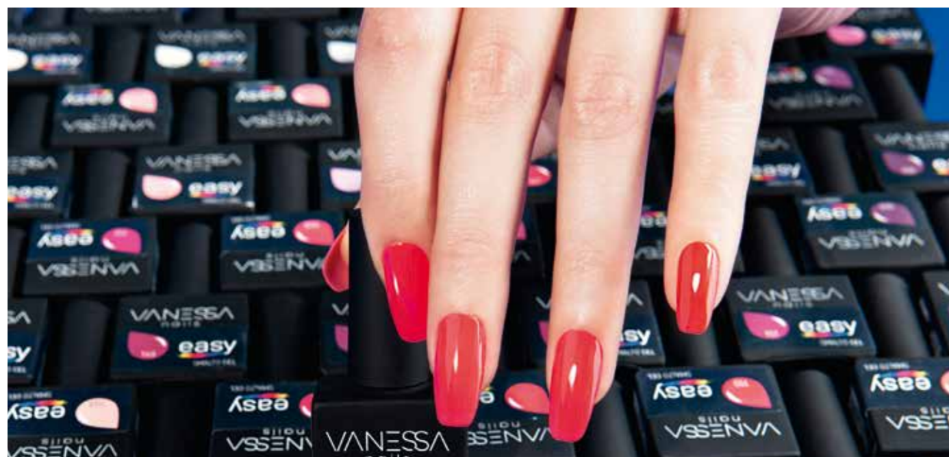
Colore smalto gel Vanessa Easy in foto art.0117

Vanessa Easy è la nuova linea di smalti gel semipermanenti colorati, un'ampia gamma di tonalità estremamente brillanti e coprenti, per unghie extra lucide e resistenti fino a tre settimane. I colori Vanessa Easy non lasciano striature e risultano molto semplici da applicare. Gli smalti Vanessa Easy assicurano una tenuta perfetta e offrono la qualità professionale ad un prezzo molto vantaggioso.