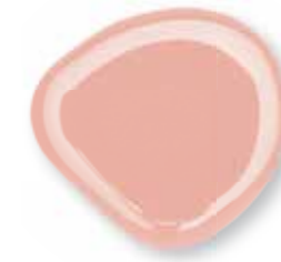
Fastgel Covering 15 ml - Rosa coprente medio 0230