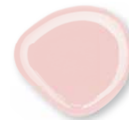
Fastgel Natural 15 ml - Rosa coprente chiaro 0229