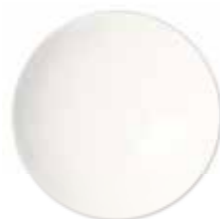
Acrygel Milky White 60 ml - Bianco coprente 0281