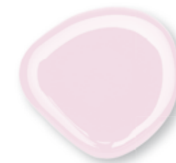
Fastgel Pink Mask 15 ml - Rosa lattiginoso 0228