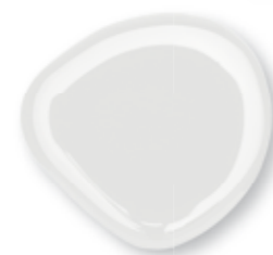
Fastgel Glass 15 ml - Trasparente 0225