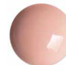
Acrygel Natural Cover 60 ml - Rosa naturale coprente 0283